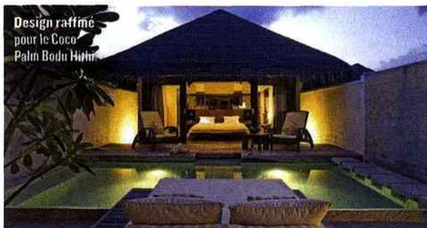
Design raffiné pour le Coco Palm Bodu Hithi.

dans l'atoll de Malé Nord et son adresse au luxe « nature » : le Coco Palm Bodu Hithi, un resort 5 étoiles récent et authentiquement maldivien. Ici, dans une nature protégée, tout est lumière, pureté et sérénité. Design, exotisme raffiné et équipement high-tech pour les spacieuses villas au grand toit de chaume, réparties entre plage et pilotis. Encore plus exclusives, les nouvelles suites Escape Water Residences avec piscine, majordome privé, restaurant et bar privés. Tout proche, le spa en aplomb d'eaux cristallines où on laisse son corps voguer au gré de soins d'origines indonésienne, thaïlandaise ou indienne. Et cinq restaurants, pour découvrir une cuisine fine et inventive. La mer est ici partout et offre à l'infini ses plaisirs, du ski nautique à la plus simple baignade. Il suffit néanmoins d'un masque avec tuba pour découvrir un univers fascinant et multicolore où se côtoient