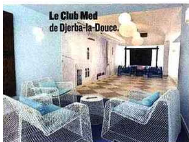
Le Club Med de Djerba-la-Douce.

... nouveau et luxueux décor, qu'a inspiré à l'architecte d'intérieur Sophie Jacquin l'art des kilims, les célèbres tapis de la région. Authentique métier à tisser, tentures pour habiller murs et sols, canapés originaux, luminaires en forme de bobines... Réception, bar ou chambres, le thème distille ses couleurs vives et chaleureuses. Egalement relooké sur le thème de l'eau, le spa et ses 12 cabines de soins. Sport, détente, fête... Petits et grands peuvent ici profiter