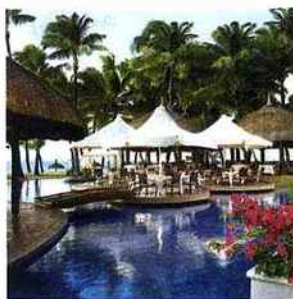
Le Saint Gérant, un palace mauricien qui n'a pas pris une ride.

Arrimé sur la côte orientale d'une île qui ne compte plus ses palaces, il vient de fêter ses 34 ans.