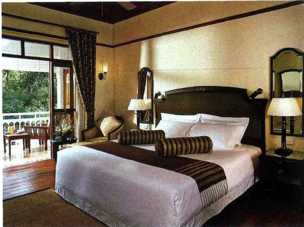
Le Sofitel Centara Grand Hotel Resort & Villas, une adresse raffinée à Hua Hin, sur le golfe de Thaïlande.

Le souverain Rama VII y fit construire en 1926 son palais d'été, faisant de ce petit port de pêche sur la côte Ouest du golfe de Thaïlande la retraite favorite de l'aristocratie et la plus ancienne station balnéaire de son royaume. C'est l'élégant Railway Hotel tout proche qui recevait ses invités de marque. A présent, sous le nom de Sofitel Centara Grand Resort & Villas - classé parmi les hôtels mythiques de cette chaîne de luxe -, il vous accueille au sein de ses immenses et luxuriants jardins. Architecture coloniale, hall d'entrée tout de marbre, meubles de teck, ambiance cosy et romantique... On cultive volontiers un cachet « old style » très british dans le bâtiment principal, mais le ton est aussi aux vacances décontractées, voire confidentielles, si l'on opte pour une charmante villa avec piscine privative.