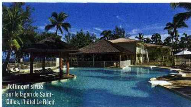
Joliment située sur le lagon de Saint-Gilles, l'hôtel Le Récif.